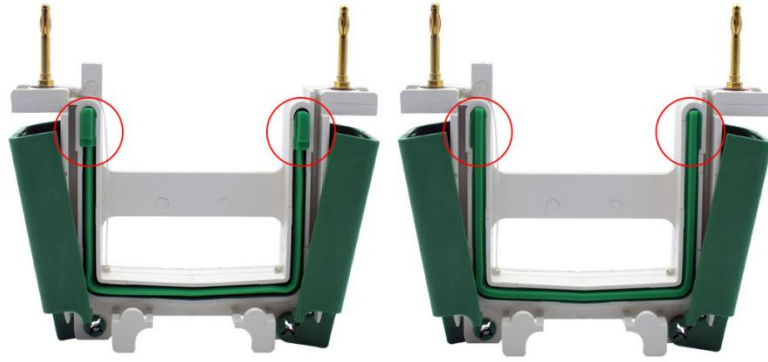
图2. 碧云天、Bio-Rad等公司的电泳槽U型硅橡胶密封条的突起结构图。由于碧云天的BeyoGel™ Elite PAGE预制胶的该部位是平的，使其兼容几乎所有厂家的小型胶电泳槽，所以电泳时须将具有突起结构的硅橡胶密封条(左图)取出后反过来安装(右图)，使其没有突起的平滑面朝外，从而防止漏液。